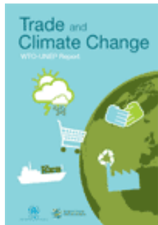
Trade and Climate Change WTO-UNEP Report