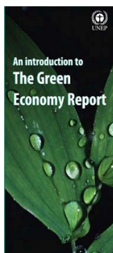
Brochure sur l'Economie verte:

Présentation du Rapport sur l'économie verte ( présentation en cours de traduction )